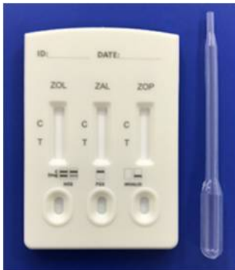
テストカード/スポイト