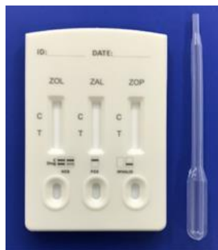
テストカード/スポイト